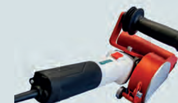
A20-20 Art.-Nr. 229014